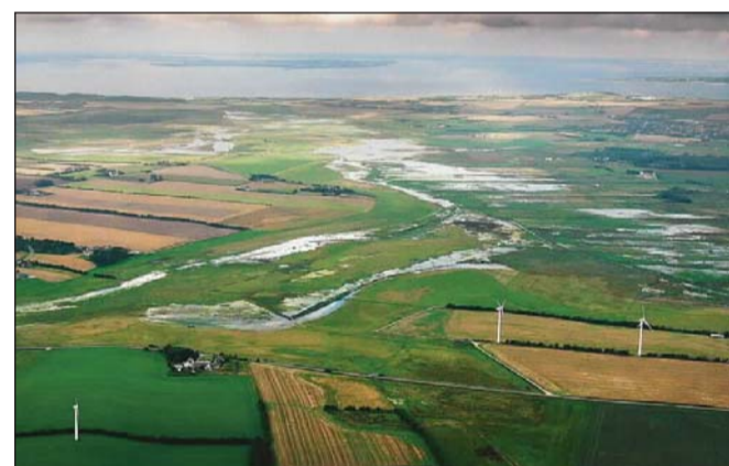
Drømmen gjort virkelig. Vilsted Sø på vej til genskabelse. Det er gjort muligt gennem næsten 200 jordfordelinger.

- Dialogen mellem projektmager og lodsejere er helt afgørende, fastslår han.